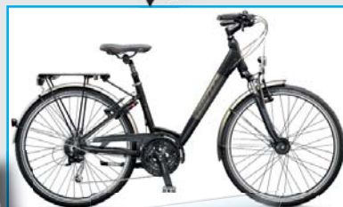
Bedretto Sfr. 899.-