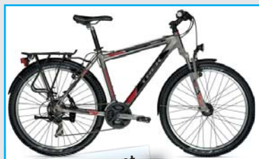
3500 Equipment Sfr. 599.- mit Nabendynamo

Wir bieten Ihnen attraktive Nettopreise!