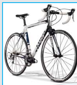
1.5 Compact + Tripad Sfr. 1'099.-